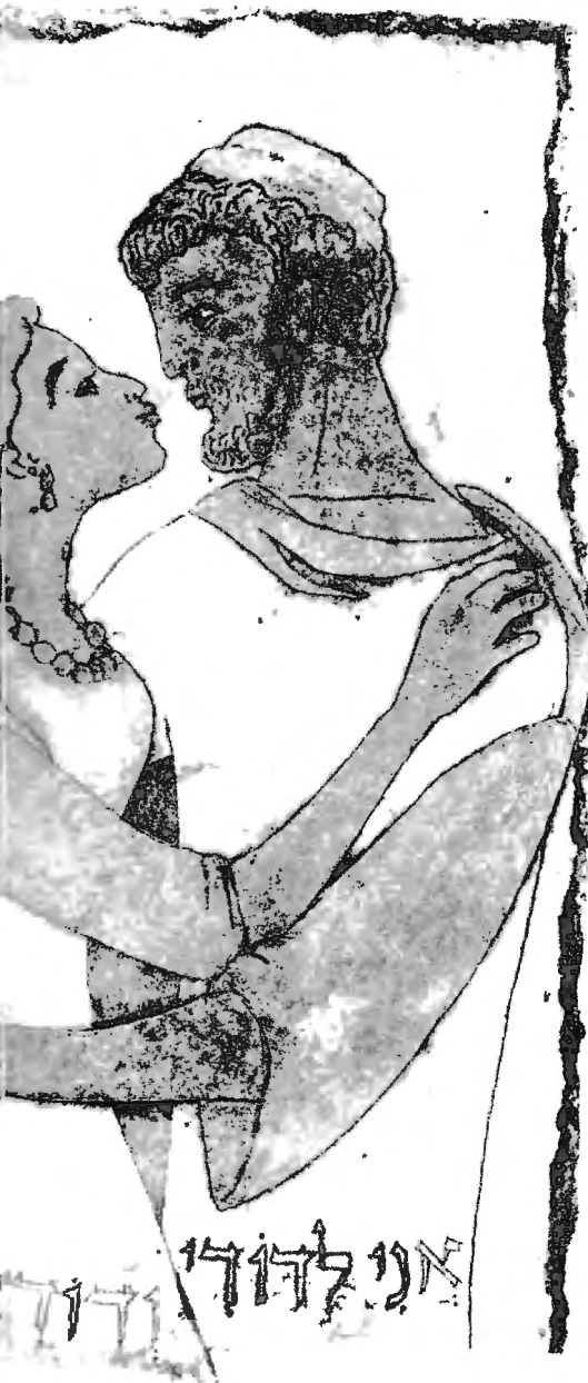
Illustratie © Lika Tov, Jeruzalem, in: Mijn lief , Hooglied uit De Nieuwe Bijbelvertaling , NBG Heerenveen 2004

innige relatie. Die relatie is werkelijk en geen schijn. Daarom is blijvend onderscheid tussen Schepper en schepsel gegeven: